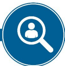
Starf skilgreint Kjarni og viðfangsefni