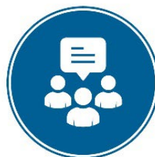
Þrjú greiningarfundir 10-20 þátttakenda