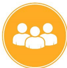
Stýrihópur Fulltrúar greinar og hagsmunaaðilar

Frekari upplýsingar um greiningarferlið er hér