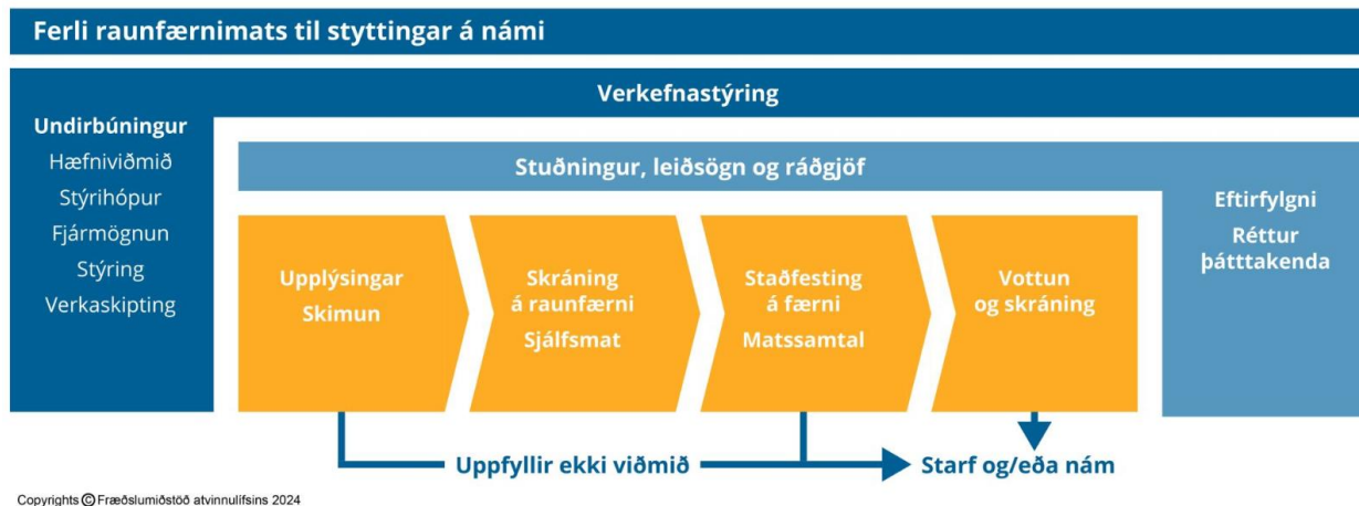
Mynd 2: Ferli raunfærnimats til styttingar á námi

Stuðst er við evrópskar leiðbeiningar um framkvæmd raunfærnimats (European guidelines for validation of non-formal and informal learning). Þær byggja á reynslu landa innan Evrópu af framkvæmd raunfærnimats sem hefur verið greind og sett fram sem leiðbeinandi handbók á vegum CEDEFOP.