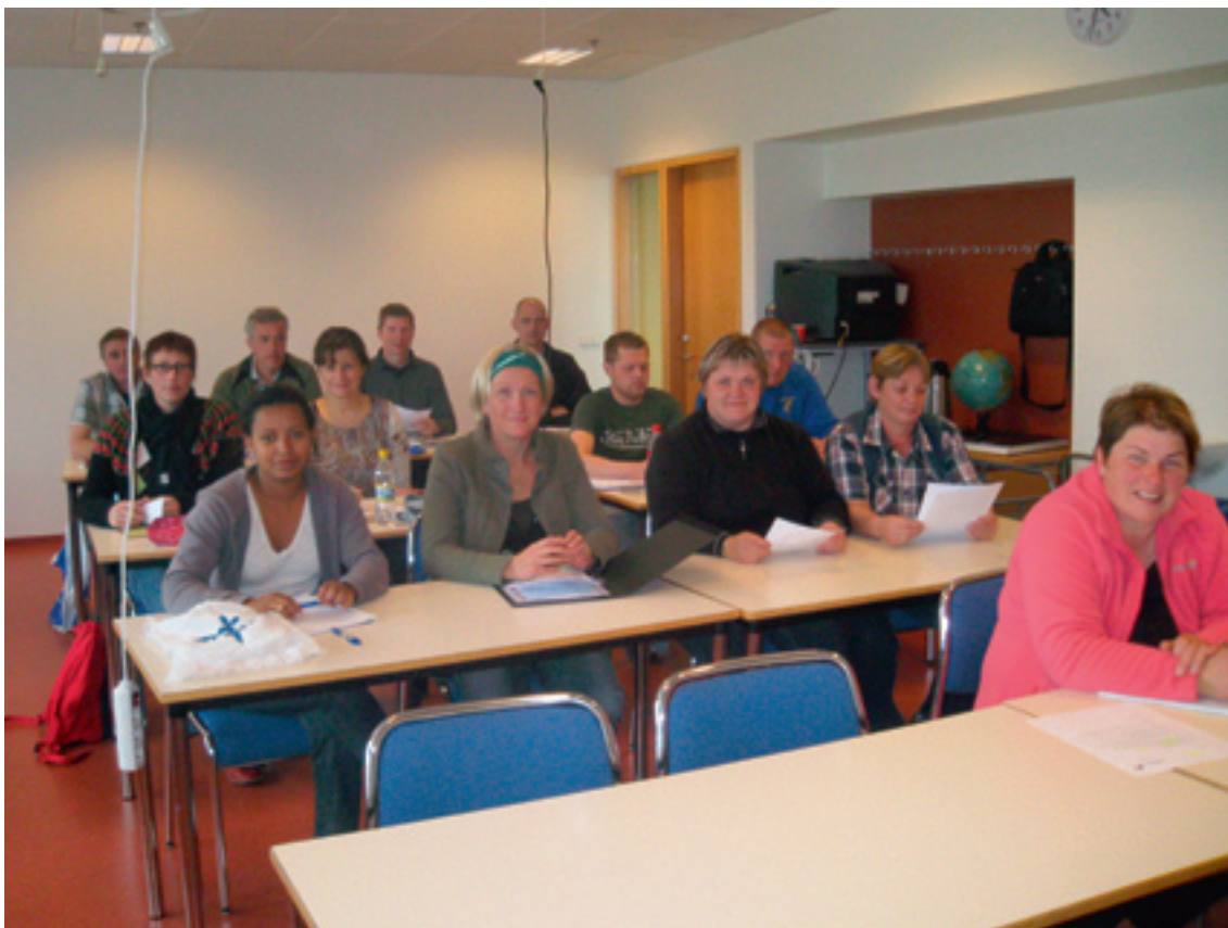
Frá námskeiðinu Fjölverkjar í fiskvinnslu.

mæta þörfum og færnikröfum lykilstarfsmanna fiskiðjuvers Skinneyjar Þinganes. Námskeiðið tók tvær annir þar sem þátttakendur lærðu m.a. um öryggi og vinnuvernd, meðferð og gæði hráefnis, stjórnun og markaðsmál. Fjölverkjanáminu luku 13 starfsmenn og Framhaldsskólinn í Austur-Skaftafellssýslu metur fjölverkjanámið til sjö eininga í matvæla- og veitingagreinum samkvæmt aðalnámskrá framhaldsskóla.